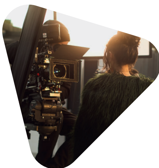
Setfoto „Insomnia“, autumn song production

Das Studium vermittelt Studierenden die grundlegenden gestalterischen, handwerklichen und organisatorischen Fähigkeiten der Kameraarbeit für Spiel- und Dokumentarfilm. Ein wichtiger Bestandteil des Curriculums sind darüber hinaus dramaturgische, kreative und produktionskompetenzen, die in Zusammenarbeit mit den Studierenden der anderen Fachschwerpunkte in einer Vielzahl von Projekten angewandt werden.